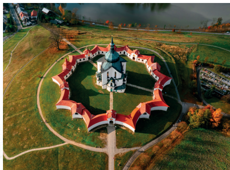
6 Poutní kostel sv. Jana Nepomuckého na Zelené hoře, UNESCO