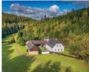
5 Šlakhamr, Hamry nad Sázavou