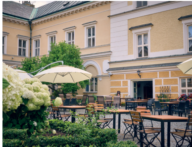
3 Zámek ve Světlé nad Sázavou