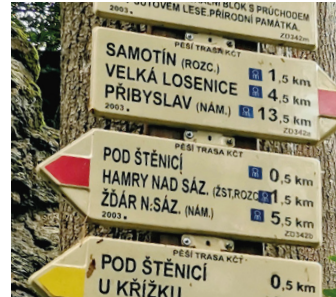
Značení Cyrilometodějské stezky