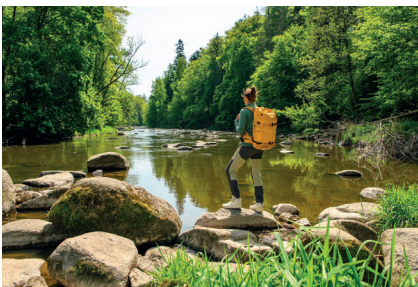
2 Přírodní rezervace Stvořidla