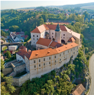
1 Hrad v Ledči nad Sázavou