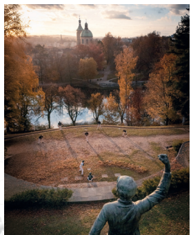
4 Park Budoucnost v Havl. Brodě