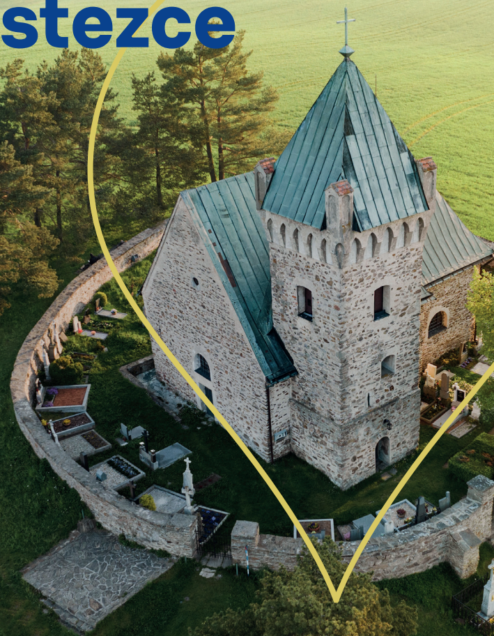
Kostel sv. Michaela Archanděla Vřtchochov

Daruj si sám sebe a zažij Vysočinu očima poutníka