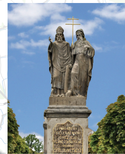
9 Socha na náměstí v Bystřici n. P.