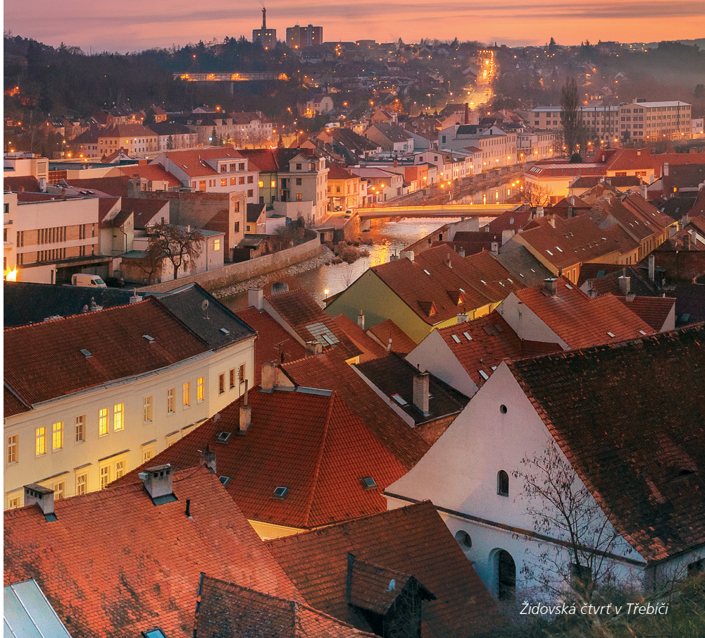
Židovská čtvrť v Třebíči

Za dlouhá staletí své existence se město stalo významným centrem Vysočiny. Vyrostlo na základech středověkého osídlení, jehož počátky jsou spjaty se založením benediktinského kláštera roku 1101 moravskými knížaty. Klášter patřil k nejbohatším v celém království a byl významným střediskem vzdělanosti.