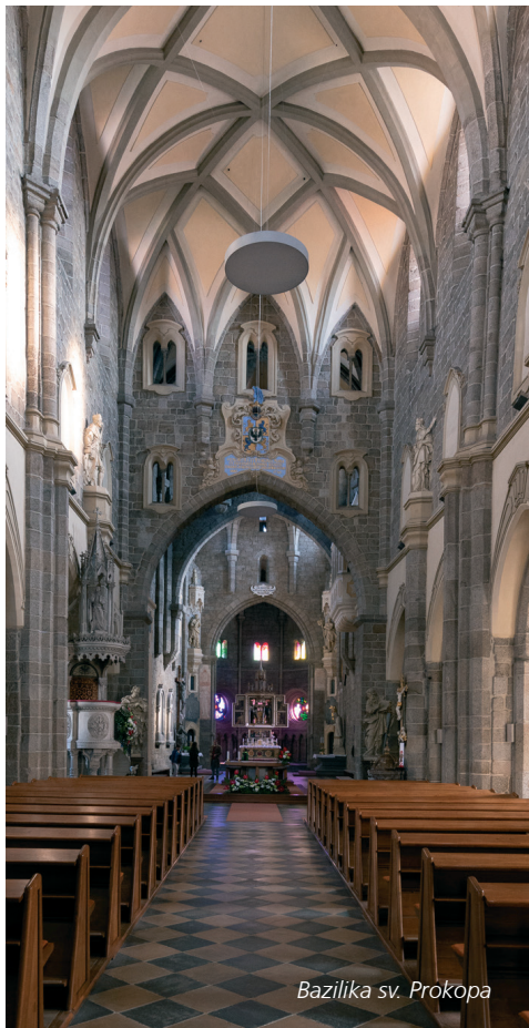
Bazilika sv. Prokopa