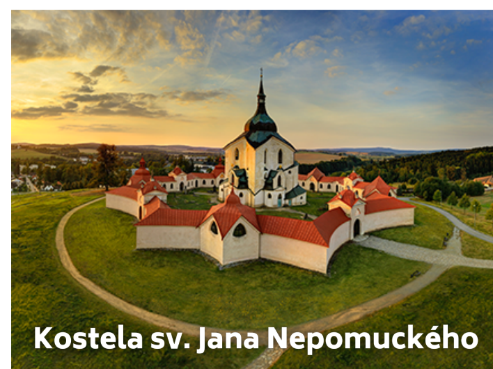
Kostela sv. Jana Nepomuckého

Multimediální a interaktivní výstava o historii vzniku kláštera. Muzeum bylo oceněno titulem 6iwa award Nej kreativnější muzeum střední Evropy 2016.