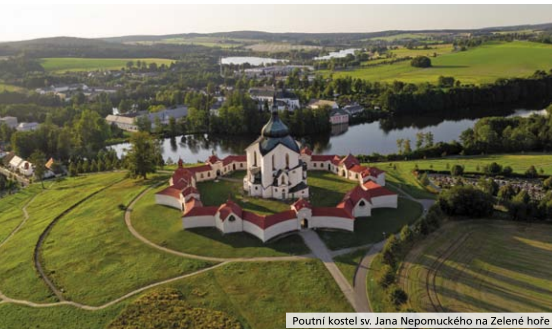
Poutní kostel sv. Jana Nepomuckého na Zelené hoře

Vysočina Film Office je regionální filmová kancelář poskytující bezplatnou asistenci všem tvůrcům a produkcím, kteří se potřebují zorientovat v Kraji Vysočina. Je součástí příspěvkové organizace Vysočina Tourism.