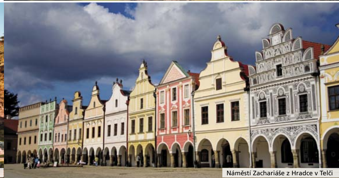
Náměstí Zachariáše z Hradce v Telči