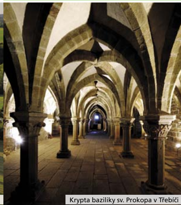
Krypta baziliky sv. Prokopa v Třebíči

Vysočina Film Office is a regional film office providing free assistance to all filmmakers and productions who need to orient themselves in the Vysočina Region. It is a part of the contributory organization Vysočina Tourism.