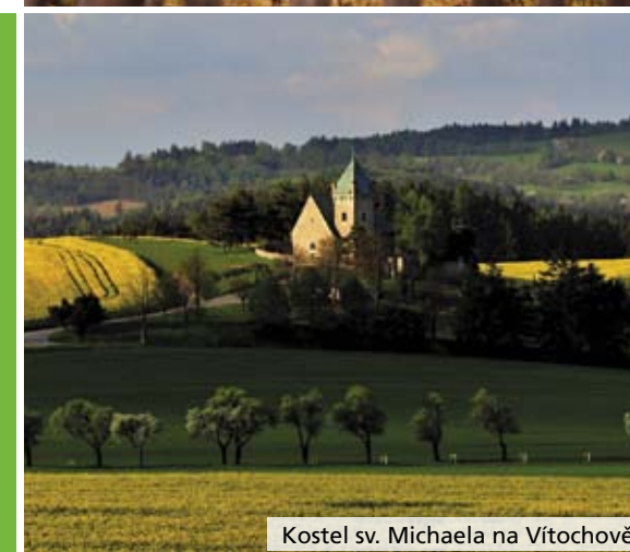
Kostel sv. Michaela na Vítchově