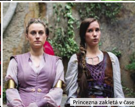
Princezna zakletá v čase