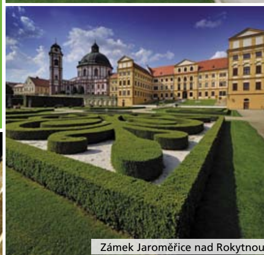
Zámek Jaroměřice nad Rokytnou