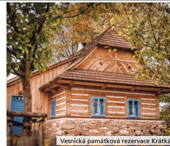
Vesnická památková rezervace Krátká