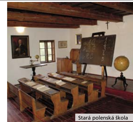
Stará polenská škola