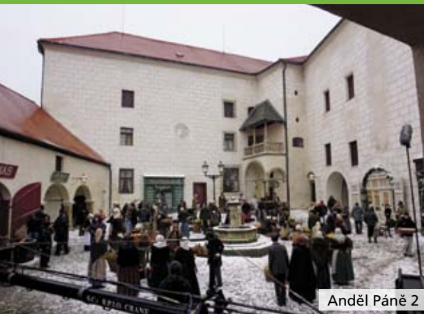
Anděl Páně 2