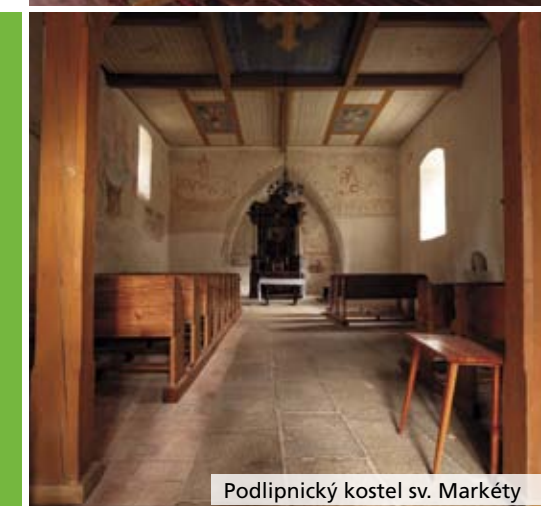
Podlipnický kostel sv. Markéty