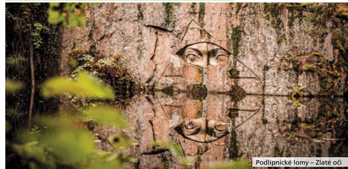
Podlipnické lomy – Zlaté oči