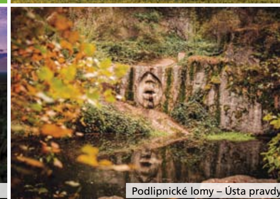
Podlipnické lomy – Ústa pravdy