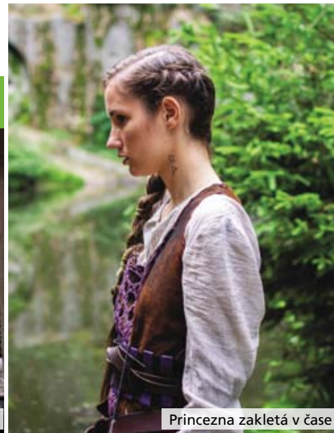
Princezna zakletá v čase