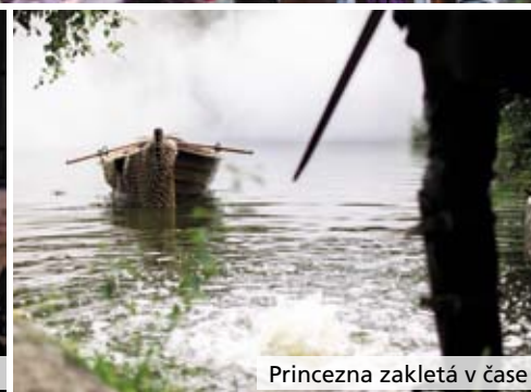
Princezna zakletá v čase