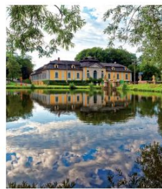
Zámek Uoší