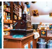
Muzeum Svaté

dotáhnout do úspěšného cíle jako například stredoškolské studenti audiovizuální tvorby. Na své si ale v malebném městě na východě Žďárská přijdou všichni milovníci mladé filmové tvorby.