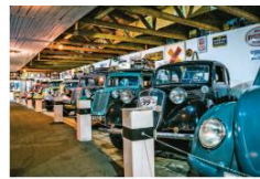
Muzeum Tatry v Bystřici

Vysočina je domovem také dvou významných festivalů spojených s audiovizuální tvorbou. V krajším městě Vysočiny se každoročně koná Mezinárodní festival dokumentárních filmů Jihlava a Bystřice nad Pernštejnem zve na Start Film Festival. Ten je určený všem, kteří stojí na startu vlastní umělecké tvorby a chtějí to