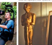
MÚZium Lípšských