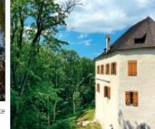
Hrad Bítov