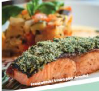
Francouzská bistro pod Javořicí