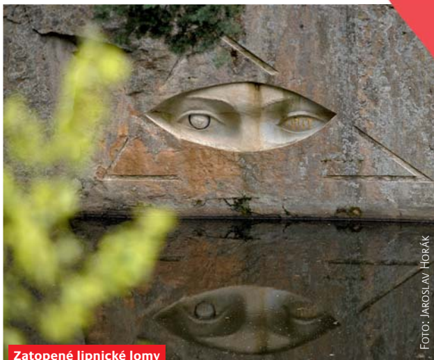
Zatopené lipnické lomy