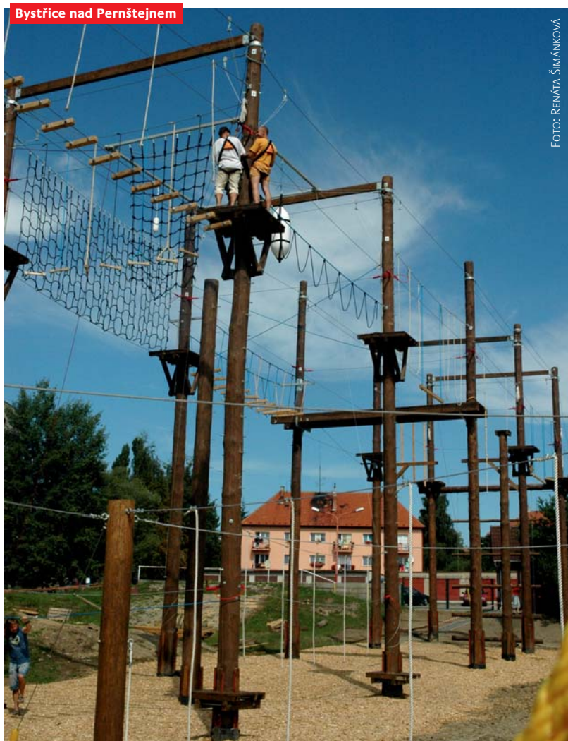
Bystřice nad Pernštejnem