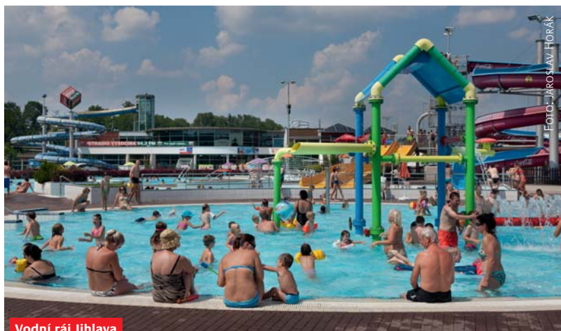
Vodní ráj Jihlava