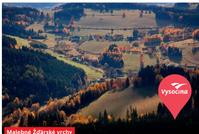
Malebné Žďárské vrchy

Podzimní Vysočina hraje všemi barvami. Její čistá příroda se zbarví do žluta, oranžova, ranní mlhy přidávají scénériím na autenticitě a všechno přímo vybízí k využití posledních slunečních paprsků, ať už prostřednictvím procházek, cyklovýletů nebo třeba podzimního putování za historií Vysočiny. Připravili jsme pro vás několik tipů, jak naplno využít podzim, ale také zimu na Vysočině.