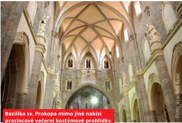
Bazilika sv. Prokopa mimo jiné nabízí prosincové večerní kostýmové prohlídky.