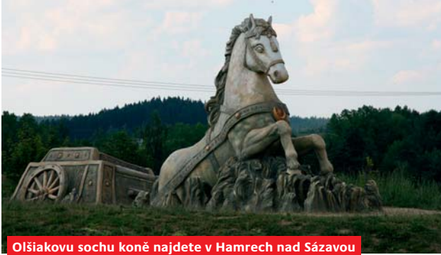
Olišakovu sochu koně najdete v Hamrech nad Sázavou