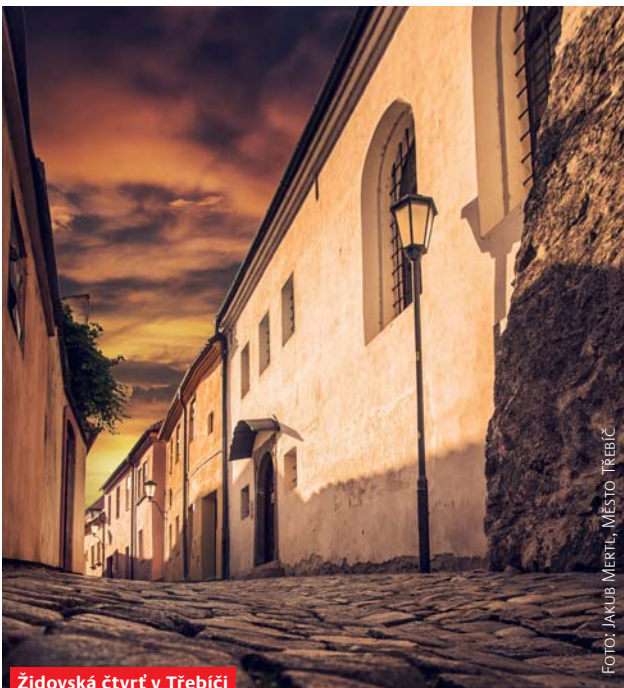
Židovská čtvrť v Třebíči