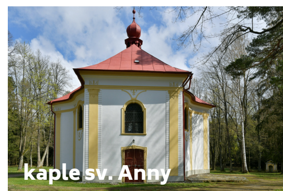
kaple sv. Anny

Probošství bylo vystavěno v roce 1714 na popud abatyše Konstancie jako jednopatrová budova s obdelníkovým půdorysem a zkosenými rohy.