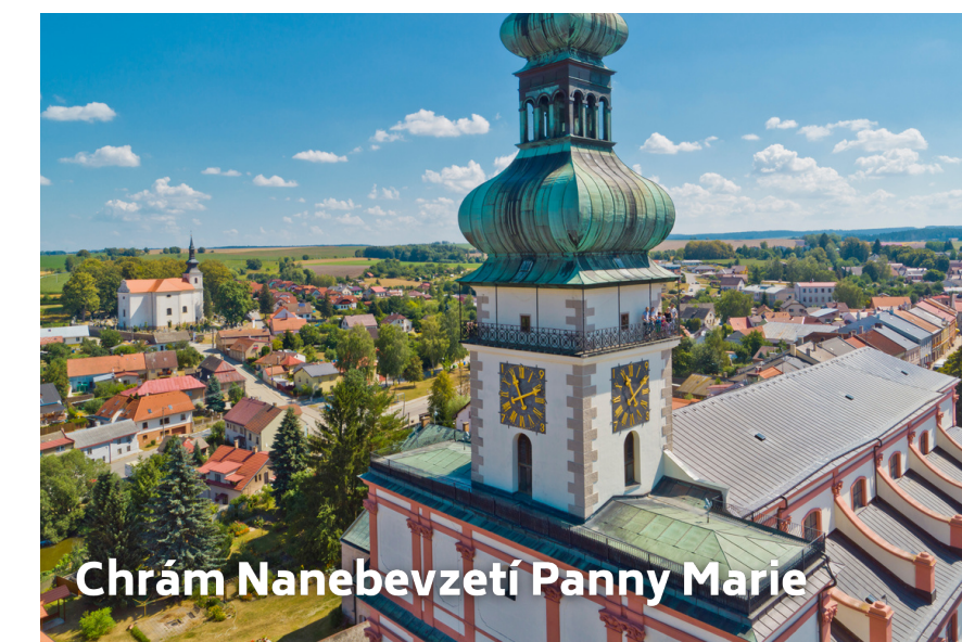
Chrám Nanebevzetí Panny Marie