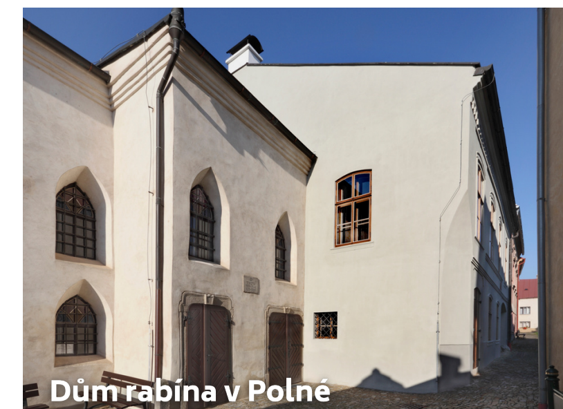
Dům rabína v Polně