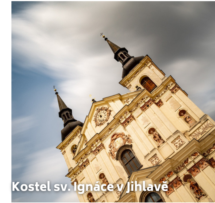
Kostel sv. Ignáce v Jihlavě