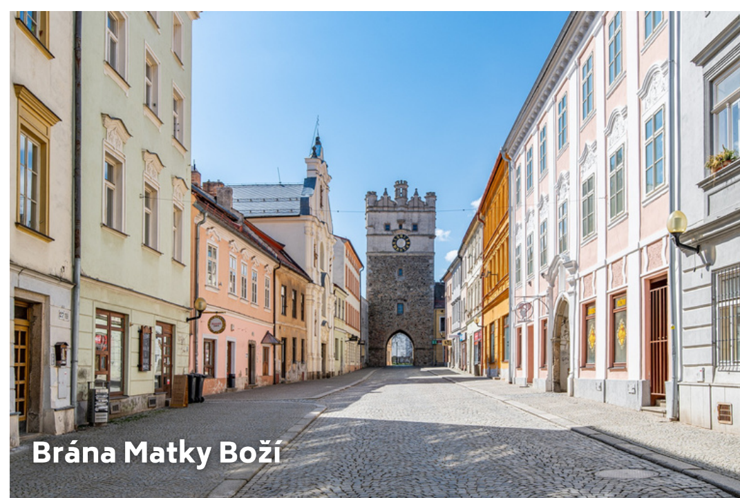
Brána Matky Boží