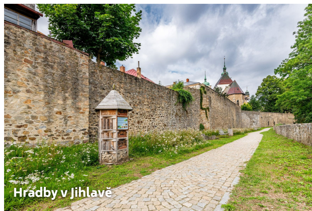
Hrádby v Jihlavě