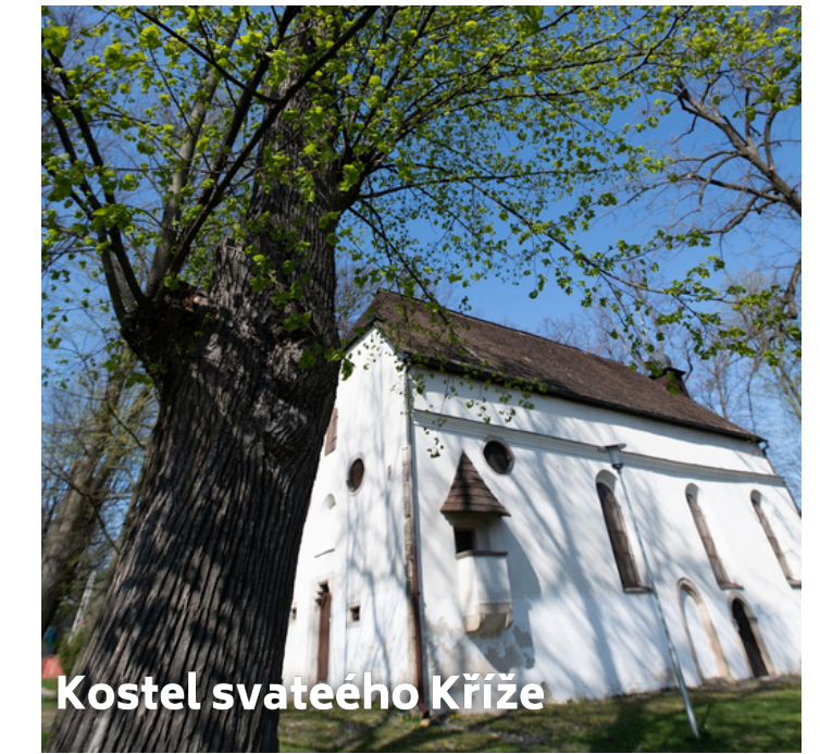
Kostel svateého Kříže