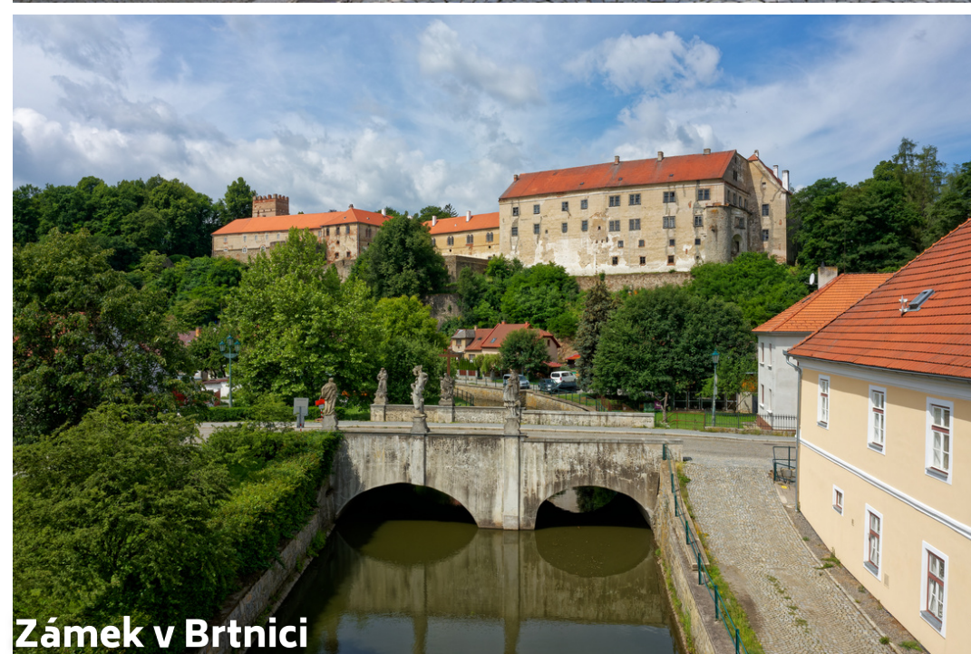
Zámek v Brtnici